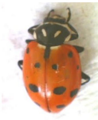
FIGURA 5: HIPPODAMIA CONVERGENS (GUERIN-MENEVILLE, 1842).