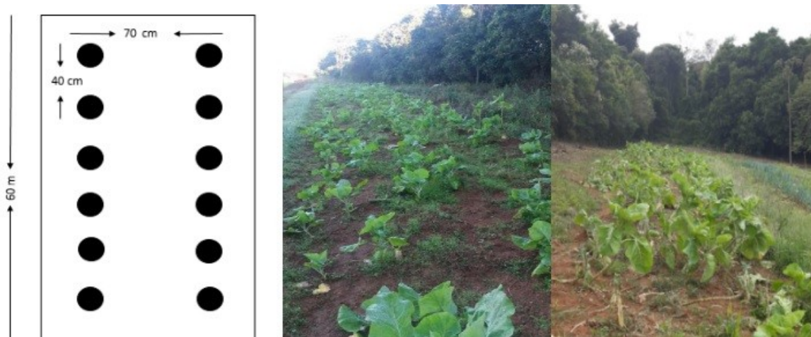
FIGURA 1: IMAGEM ILUSTRATIVA DO CULTIVO DE COUVE DO IF SUL DE MINAS – MACHADO MG.

As coletas de coccinelídeos foram conduzidas no Setor de Olericultura do Instituto Federal do Sul de Minas Gerais - IFSULDEMINAS, Campus de Machado, MG, no período de 20 de março a 31 de julho de 2019, realizadas no período da manhã entre 8:00 e 9:00 horas. As amostragens foram conduzidas em plantas de couve B. oleracea L. var. acephala , dispostas em sete canteiros de 60 metros de comprimento, com espaço de 40 cm entre uma planta e outra e 70 cm entre as linhas (Figura 1). As folhas da couve são coletadas de 3 a 4 vezes por semana para complemento alimentício do refeitório da instituição, onde centenas de pessoas se alimentam todos os dias.