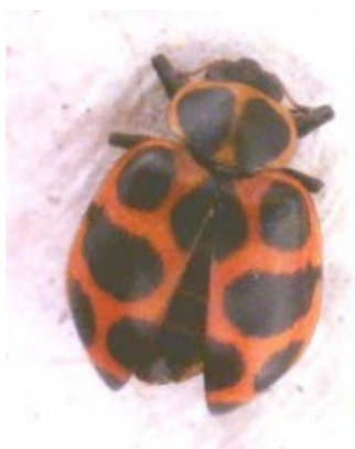
FIGURA 6: COLEOMEGILLA MACULATA (DEGEER, 1775).