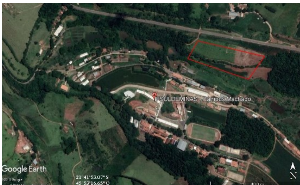
FIGURA 2: IMAGEM AÉREA DA LOCALIZAÇÃO DA HORTA DO IF SUL DE MINAS – MACHADO MG.