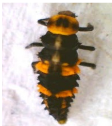
FIGURA 7: LARVA DE COCCINELÍDEO.

Foram coletados 4 larvas de Coccinellidae com frequência relativa equivalente a 11,42% do total de amostras (figura 7). Adultos de joaninhas depositam seus ovos sobre as plantas que dão origem a larvas do tipo campodeiforme, possuem alta voracidade, e a cada mudança de instar aumenta sua capacidade de predação, dominando o habitat de suas presas (HODEK 1973 apud CASTRO, 2010).