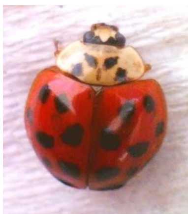
FIGURA 3: HARMONIA AXYRIDIS (PALLAS, 1773).

A espécie que apresentou menor frequência relativa foi a C. macullata , com apenas 1 exemplar (2,85%) coletado durante toda a pesquisa. Apesar do baixo número de indivíduos coletados a espécie apresenta grande importância no controle de pulgões e de lagartas na cultura de milho, algodão e sorgo (SILVA et al., 2009) (Figura 6).