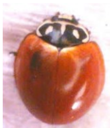
FIGURA 4: CYCLONEDA SANGUINEA (L.).