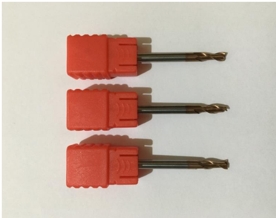
FIGURA 2 - FRESAS ADQUIRIDAS PARA OS TESTES

Visando reduzir os impactos causados por desgaste da ferramenta, foram adquiridas três fresas, e foi utilizado uma para cada material testado. Na FIGURA 2 é possível visualizar as fresas adquiridas.