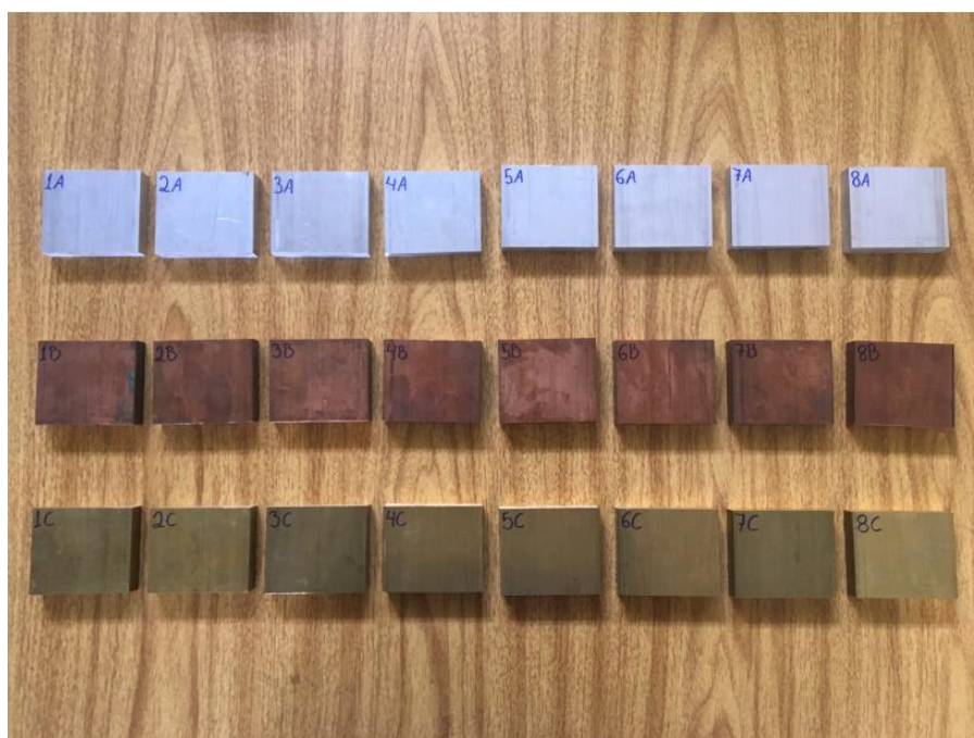
FIGURA 3 – CORPOS DE PROVA UTILIZADOS NOS EXPERIMENTOS