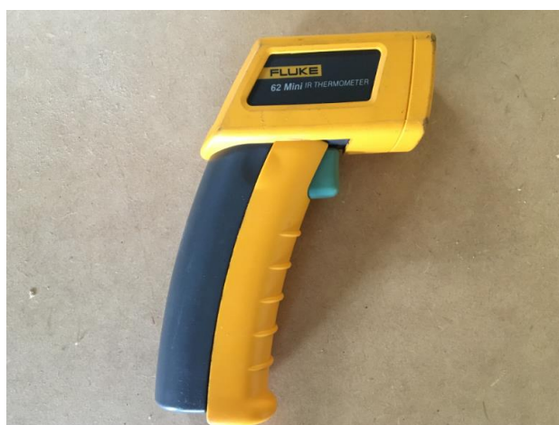
FIGURA 5 - PIRÔMETRO FLUKE 62 MINI IR

As temperaturas do motor de passo do eixo Y da fresadora foram medidas durante o processo com o auxílio de um pirômetro Fluke 62 Mini IR, que é ilustrado na FIGURA 5. A variação de temperatura foi utilizada como um parâmetro de monitoramento durante o processo de usinagem, visando verificar se o motor ficaria sobrecarregado. Foi escolhido o motor do eixo Y, pois é o motor responsável pela movimentação da ferramenta por toda a extensão da usinagem.