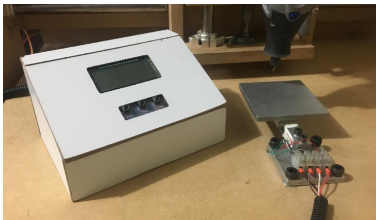
FIGURA 4 - DISPOSITIVO DE MEDIÇÃO MONTADO NA FRESADORA