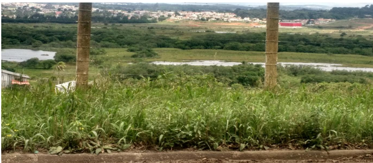
FIGURA 5 – FINAL DO TRAÇADO PROPOSTO, ESTRADA DELEGADO BRUNO DE ALMEIDA, CURITIBA.

A diretriz da rodovia se desenvolve no sentido Sul rumo ao Norte por um terreno plano e ondulado, até encontrar a Estrada Delegado Bruno de Almeida, localizada no Bairro Caximba em Curitiba (25°37'37"S e 49°20'55" O) conforme FIGURA 5.