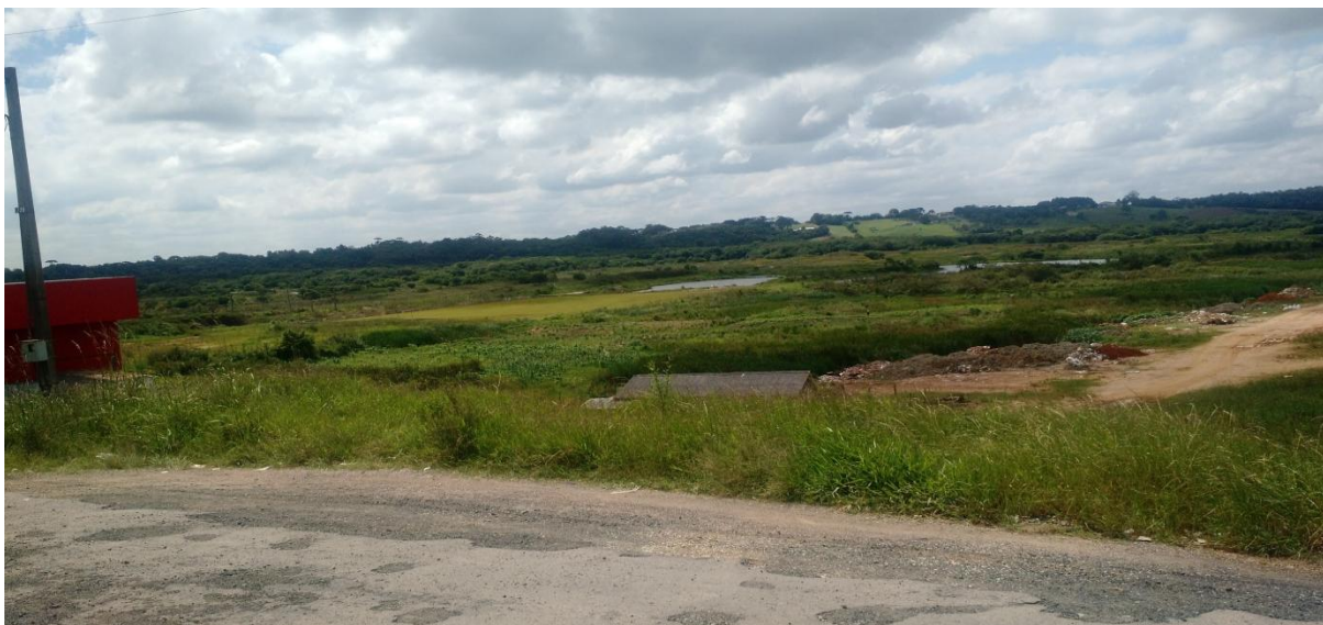
FIGURA 4 – INÍCIO DO TRAÇADO PROPOSTO, ESTRADA DO AREAL, FAZENDA RIO GRANDE.

A diretriz do trecho inicia-se na Estrada do Areal, localizada no Bairro Iguaçu em Fazenda Rio Grande (25°38'41"S e 49°20'21" O) conforme demonstra a FIGURA 4.