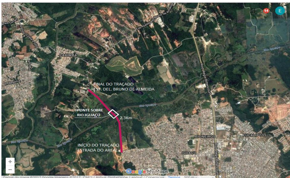
FIGURA 33 – ESCOLHA DO TRAÇADO

A FIGURA 33 indica o trajeto alternativo proposto para que os moradores de Fazenda Rio Grande se desloquem para o Bairro da Caximba e seus arredores, com uma extensão de 2,30 Km. (GOOGLE MYMAPS, 2017).