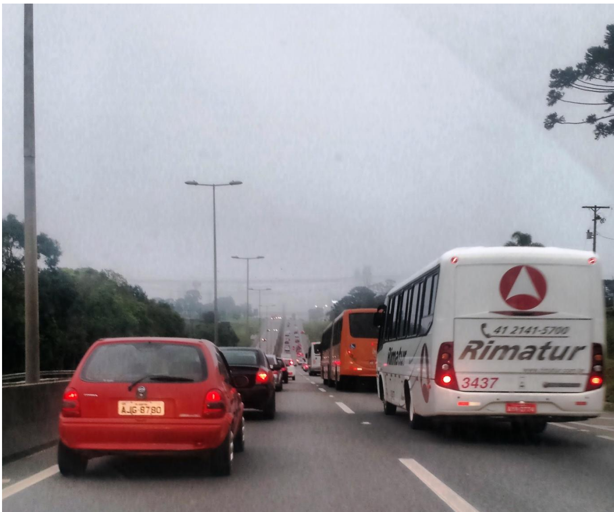
FIGURA 2 – CONGESTIONAMENTO NA RODOVIA BR 116 SENTIDO CURITIBA

A FIGURA 2 ilustra o congestionamento na pista de Fazenda Rio Grande sentido Curitiba.