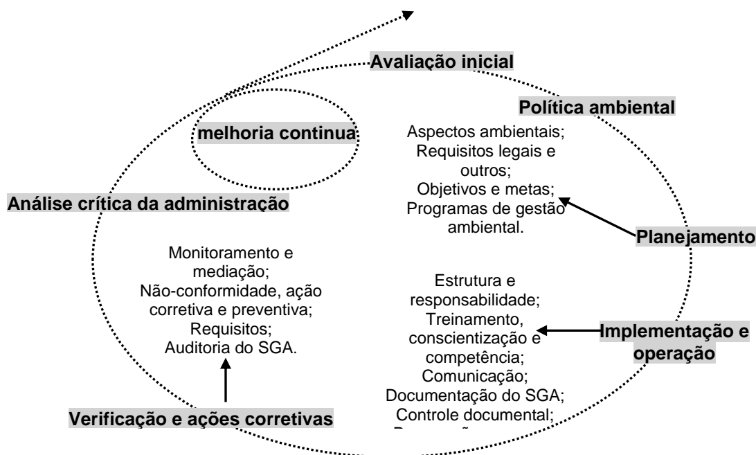
FIGURA 2: REQUISITOS BÁSICOS DE UM SISTEMA DE GESTÃO AMBIENTAL FONTE: ADAPTADA DA ABNT – NBR ISO 14001 (1996)