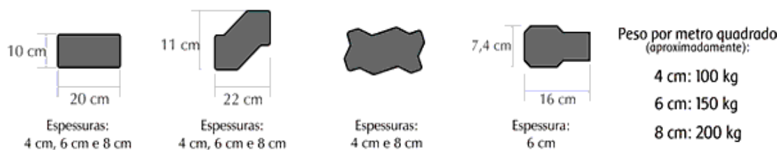
FIGURA 1: BLOCOS DE CONCRETOS

Estes blocos também podem ser encontrados em diferentes padrões de cor, conforme a Figura 2.