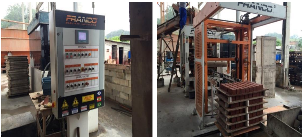
FIGURA 5: MÁQUINA QUE FORMA AS PILHAS E Prensagem e empilhamento

Nesta última etapa a cura é do tipo normal, no qual a idade de ruptura do corpo de prova é a prevista no plano da obra (j dias). Sendo o corpo de prova o elemento que será analisado e testado a cada lote produzido, as peças representativas do lote amostrado devem estar nas condições de saturação de água, as superfícies de carregamento capeadas com argamassa de enxofre ou similar, com espessura inferior a 3 mm, o resultado da resistência a compressão (em MPa), obtida dividindo-se a carga de ruptura (em N) pela área de carregamento (em mm 2 ), multiplicando-se o resultado pelo fator “p”, função da altura da peça, a fim de aferir sua qualidade em acordo com a norma vigente; normalmente a idade ótima para ruptura e verificação da resistência mecânica é de 28 dias. É permitida a avaliação prévia da resistência com idade menor, desde que se tenha determinado a relação entre as resistências nessa idade e na idade prevista, usando-se de preferência a idade de sete dias para cura normal e um dia para cura térmica, NBR 5738 (ABNT, 2003).