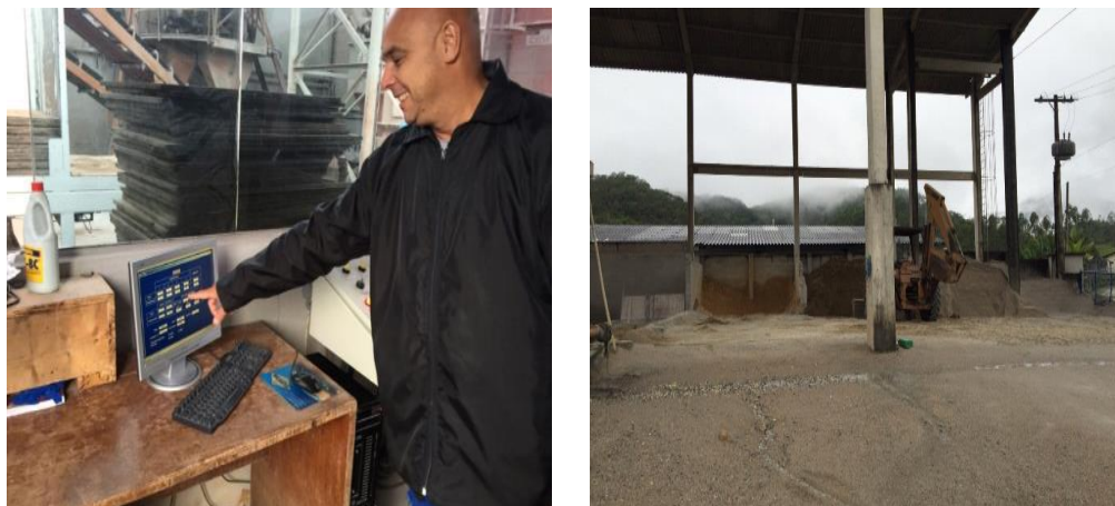
FIGURA 4: GESTÃO DA PRODUÇÃO COM AGENDAMENTO E ARMAZENAGEM DOS AGREGADOS EM BAIAS FONTE: AUTORES (2017)

Com o takt time todos os processos são identificados desde o MFV, e a diferença entre a capacidade e a demanda é calculada, observando se há lacuna em relação ao plano de implementação enxuta, que é executado desde a aquisição dos insumos.