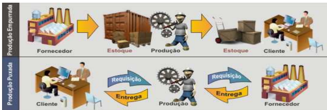
FIGURA 2: SISTEMA DE PRODUÇÃO JIT